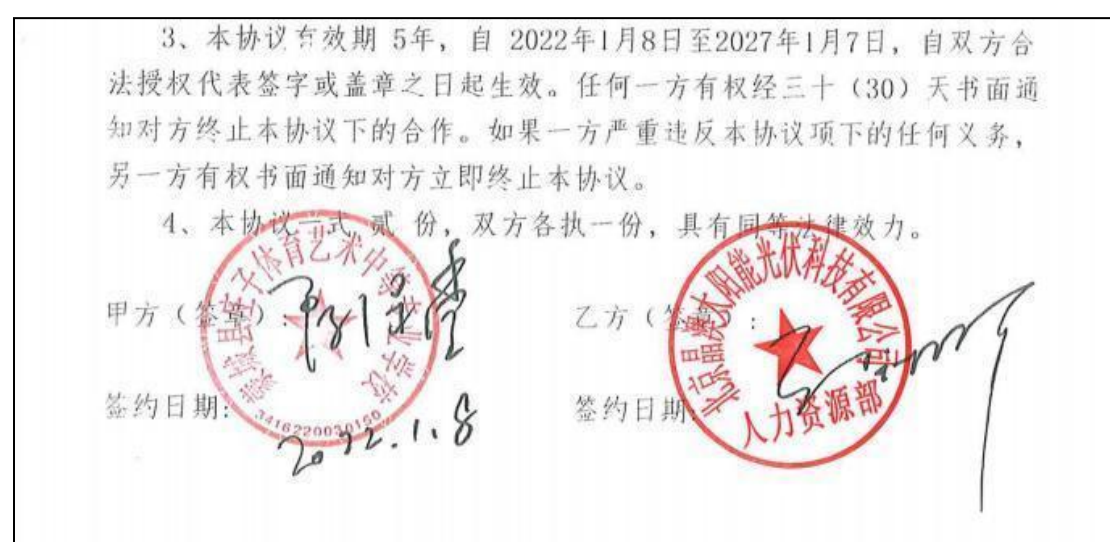
图 14 校企合作协议

人较上年增加 287 人，就业人数 436 人，就业率 97.3%，毕业生专业对口就业 94.25%，毕业生服务三次产业人数 441 人，就业单位对毕业生职业素养及职业技能的满意度 97.5%，初次就业月收入 3500 元。