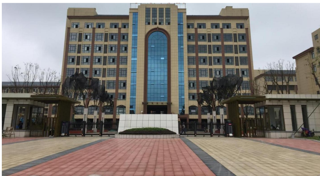
图 2 学校综合实训办公楼