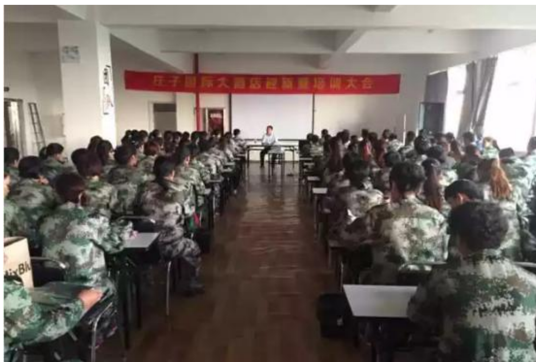
图 19 实习生岗前培训（烹饪）

先后与蒙城庄子国际大酒店、蒙城县电商孵化园建立了稳定的实习基地，历届学生就业率达 90%以上，毕业学生工作得到保障，办学得到了家长、学生、企业的一致好评。2024 年毕业学生 587 人，就业率为 97%，月薪平均不低于 3500 元。在毕业生安置前，学校本着对学生高度负责的精神，毕业生到企业前均接受就业和创业指导，进行艰苦奋斗、吃苦耐劳精神和安全观的教育，使学生能够尽快适应岗位的要求。