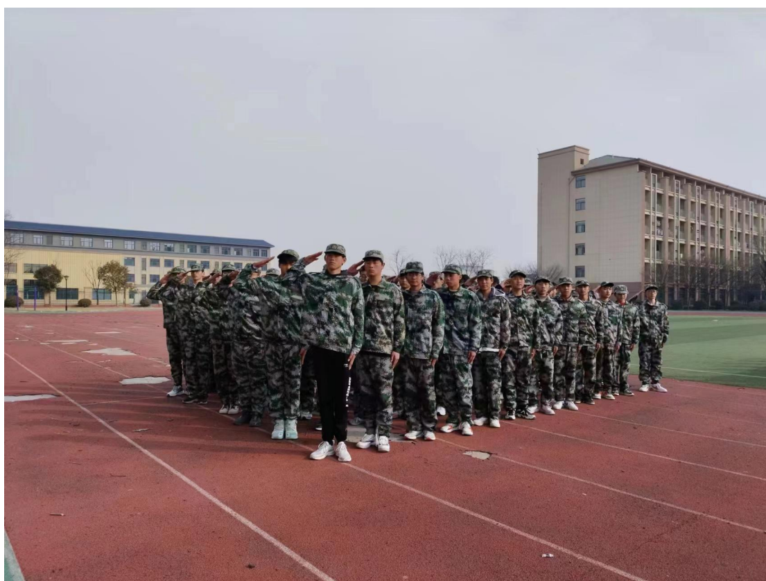
图 27 军事化管理训练