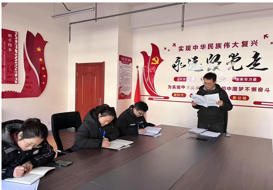
图 21 支部党员上党课

7.2 党建引领。 学校坚持以习近平新时代中国特色社会主义思想为指导，认真贯彻落实党的二十大精神，坚持“三会一课”、主题党日、政治生日等党建制度，严格组织生活，突出党性，加强党组织建设。坚持党全面的领导，以各处室为单位，明确分工，细化责任，发挥党组织战斗堡垒作用，以党建带团建，积极组织师生学习党的二十大精神，提升全校师生思想认识，激发干事创业动力，从思想教育、理论提升、技能训练等方面促进学生成长，教育学生听党话、感党恩、跟党走，立志高远，努力学习，全面提升学生发展质量。