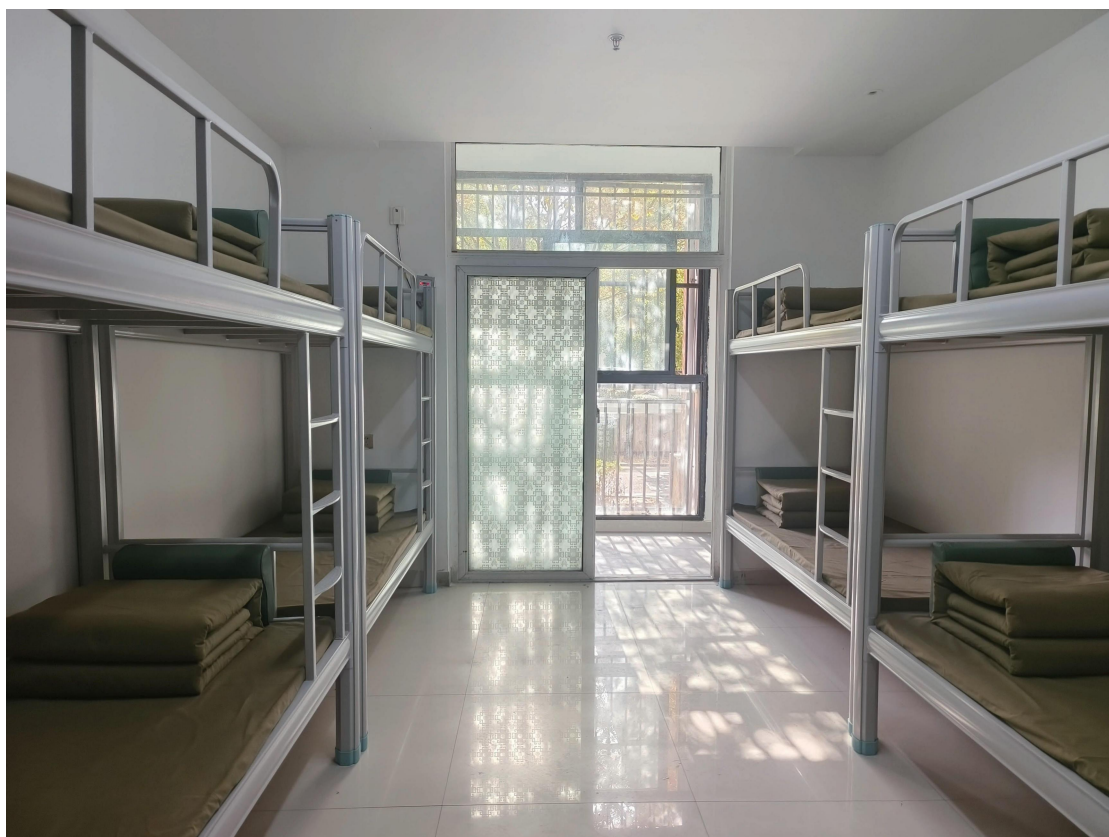
图 11 学生宿舍