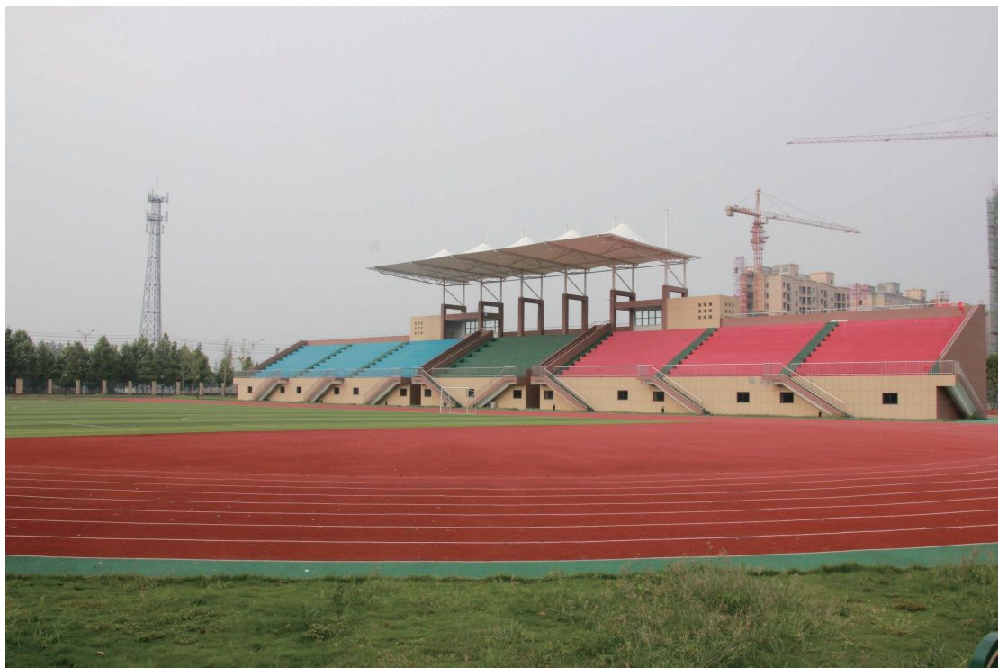
图 10 学校操场