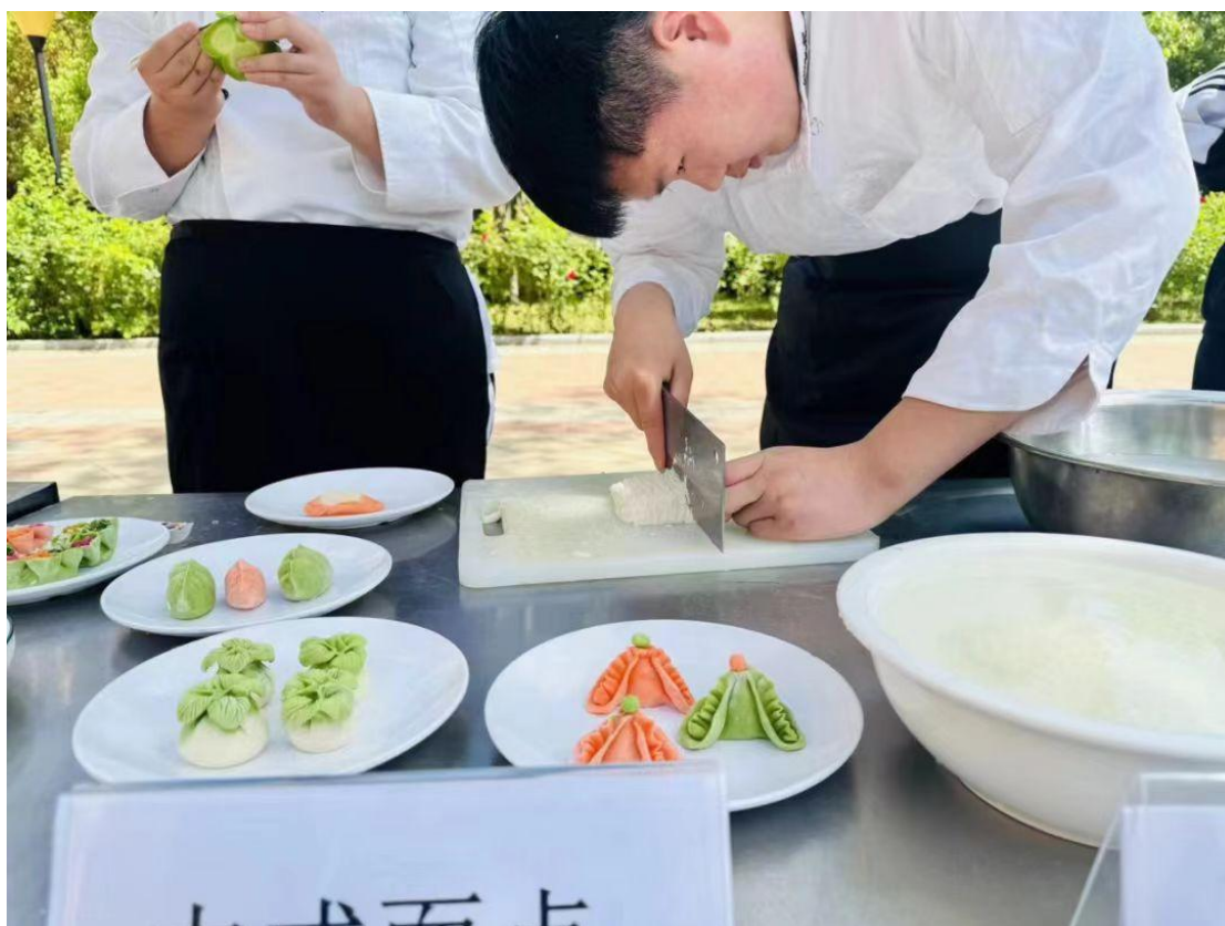
图 30 烹饪专业学生作品展示