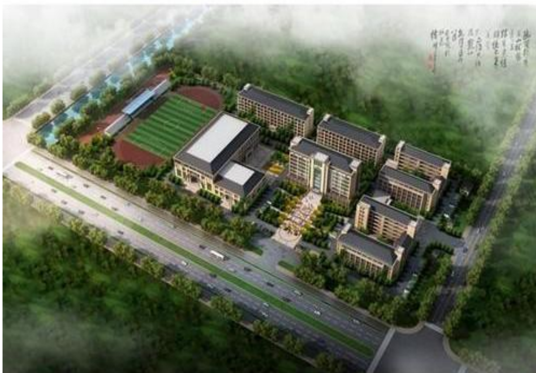
图 1 学校鸟瞰图