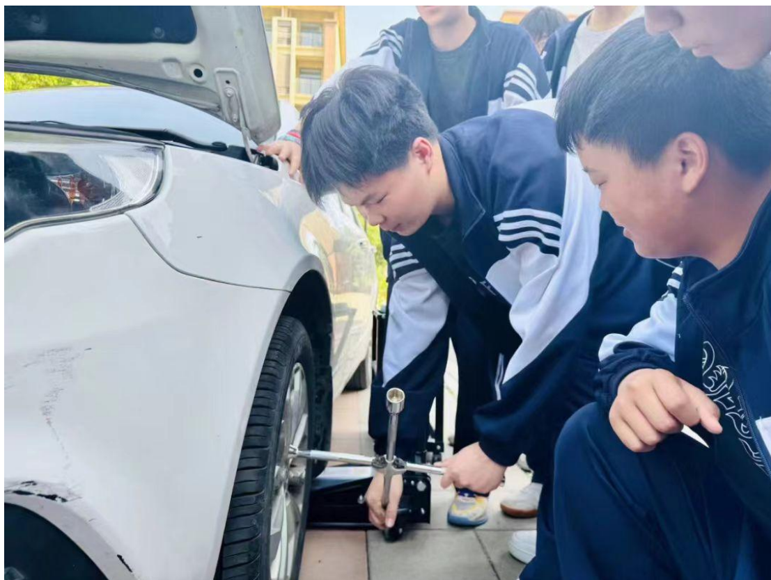
图 32 新能源汽车专业学生技能展示