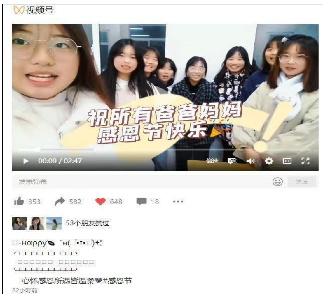
图 6 感恩父母-视频号传播正能量