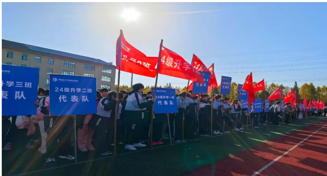
图 5 校园田径运动会