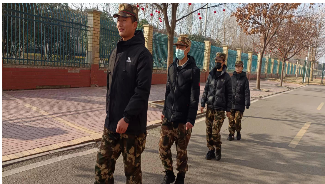
图 26 教官巡查校园