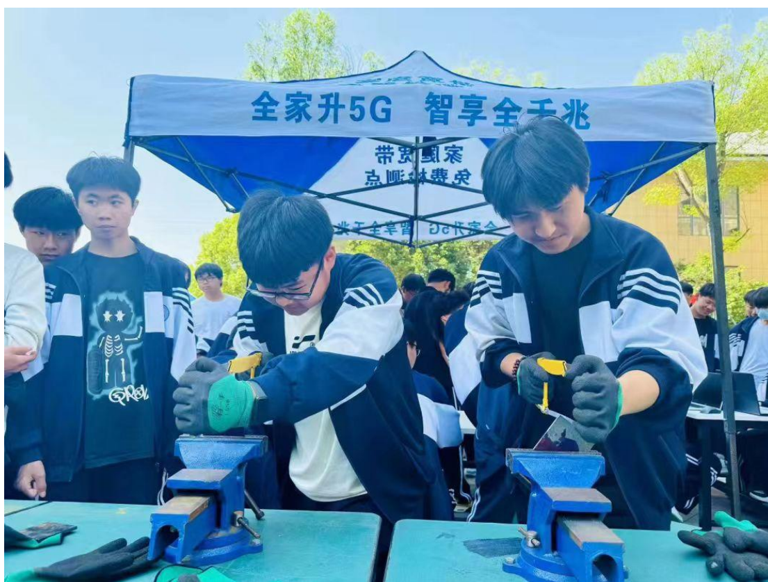
图 31 工业机器人专业学生技能展示