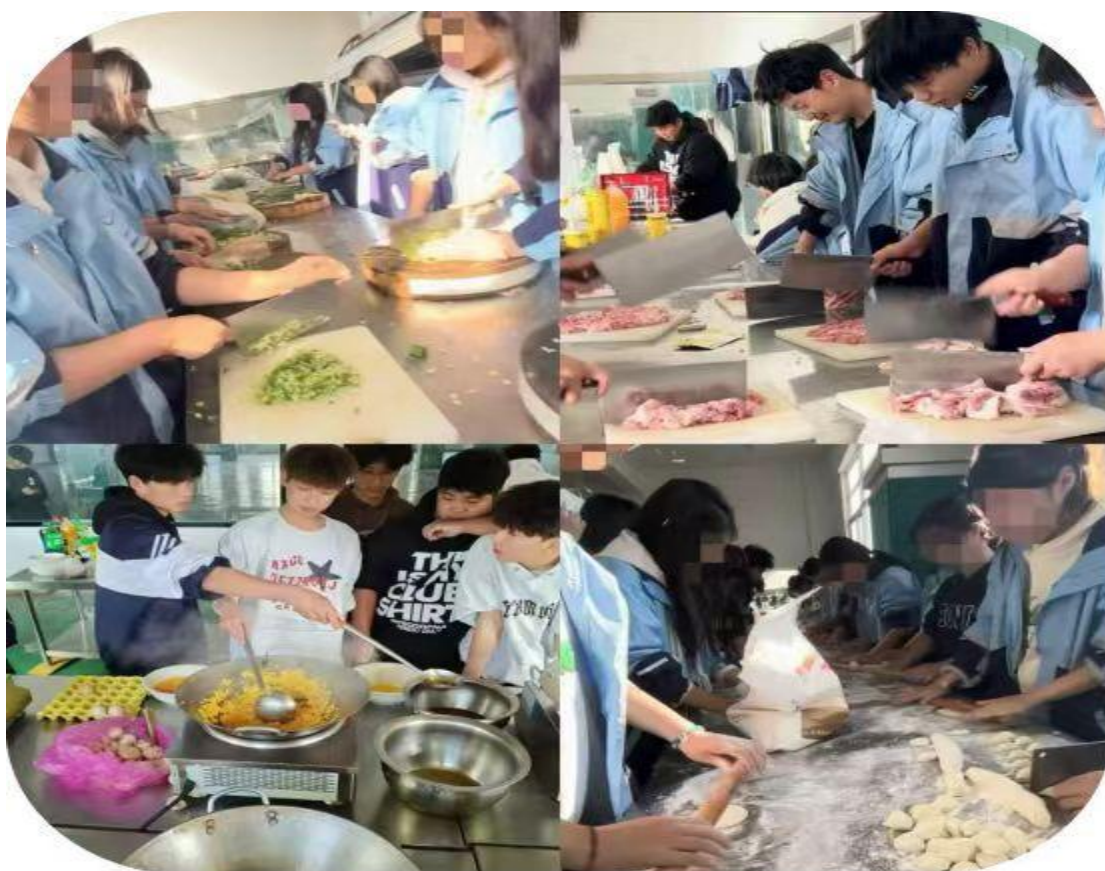
图 4 冬至包饺子主题活动