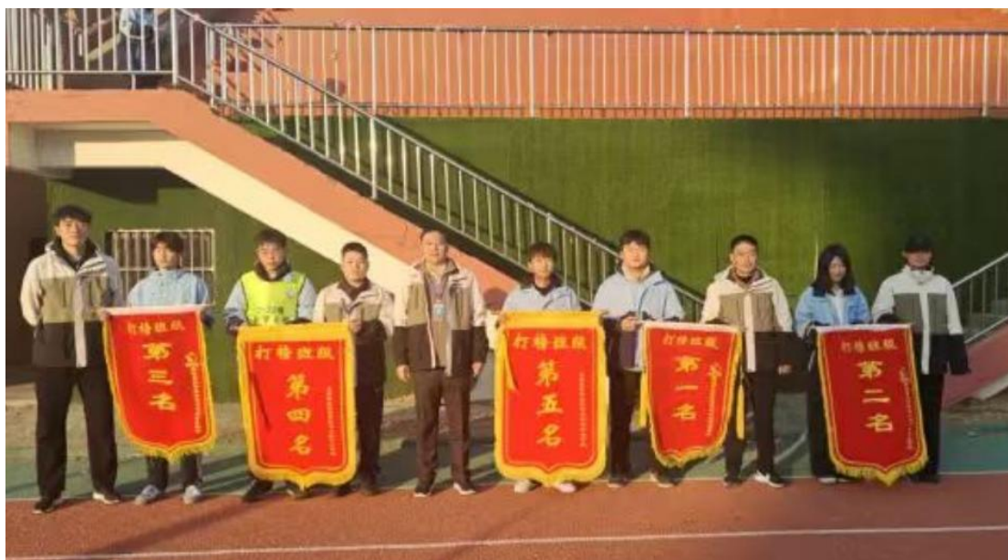
图 16 优秀班级评比

4.2 红色文化传承。 学校党支部以党建“五大行动”为抓手，建强“红色堡垒”。通过先进典型人物宣讲，举办建党节庆祝活动或以微党课和文艺宣讲等形式开展红色文化教育；通过活动的开展宣讲红色文化等活动，使校园充满红色氛围，让学生了解党、信任党、热爱党。