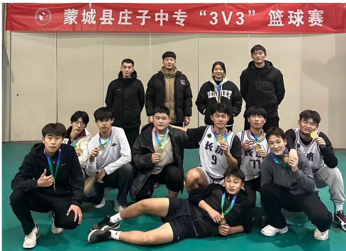
图 13 篮球赛活动

2.4 职业发展。 学校定期组织学生到企业实习实训，了解行业企业需求，为专业设置、专业人才培养方案、课程设置等提出建议，提升人才培养质量和就业质量。毕业生总数 587