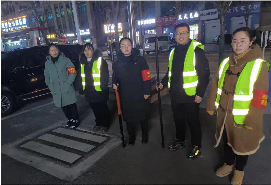
图 22 党员参与社区“平安巡夜”活动

7.3 制度保障。 制度是执行一切任务的保障,根据学校实际,在广泛征求教职员工意见的基础上,进一步制定完善学校教学、教研、实训、财务、后勤、公物、招生、学生管理、德育工作等各项管理制度,让工作有章可循、有据可依,进一步提高工作效率。沿承学校“全、细、实、严”的管理模式,分工明确、职责分明、考勤到位,在学校形成全员参与齐抓共管的局面。