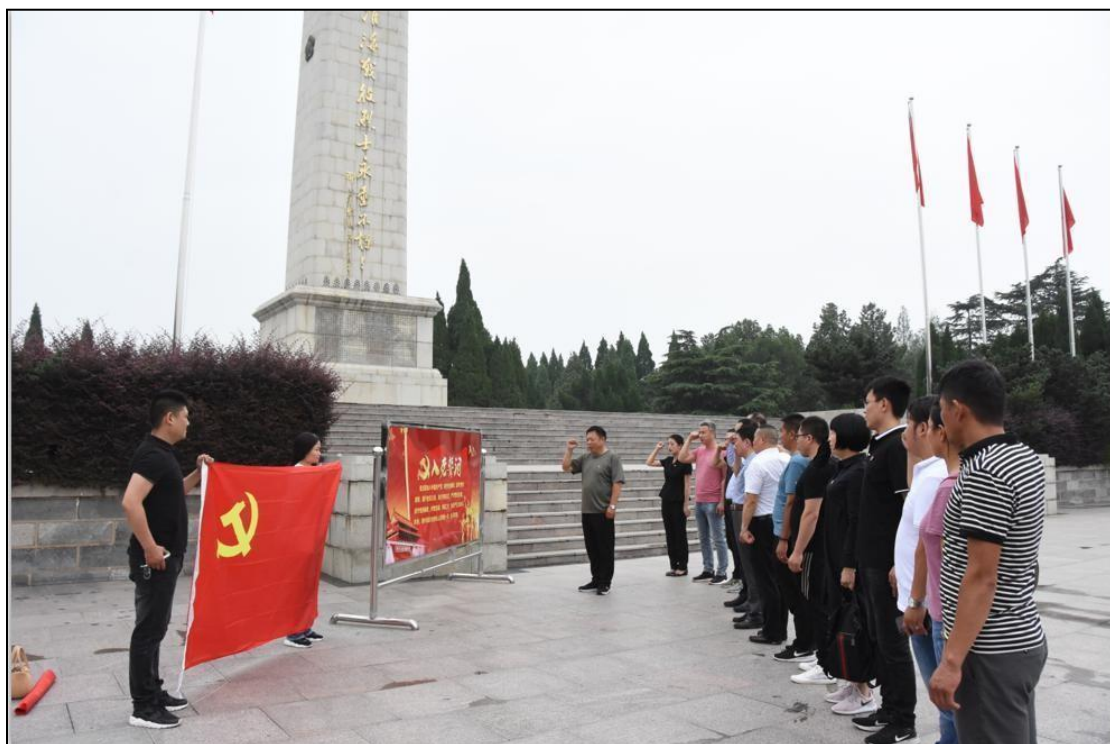
图 18 学校党支部红色革命根据地学习