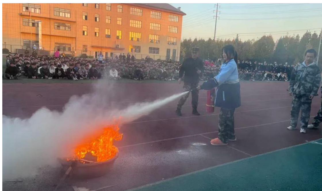
图 23 救火灭火安全演练

查消除安全隐患、排查化解矛盾，把问题和矛盾消灭在萌芽中，防止恶性事故发生；严格执行食品卫生管理有关规定，防止食物中毒事故的发生；聘请交警、公安、消防等部门人员来校作专题讲座，增强学生的法制观念和自我保护意识；与家庭、社会配合，齐抓共管、群防群治，学校安全工作取得良好的效果。