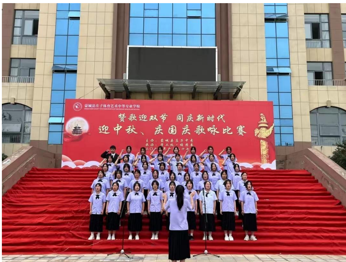
图 3 校园红歌比赛