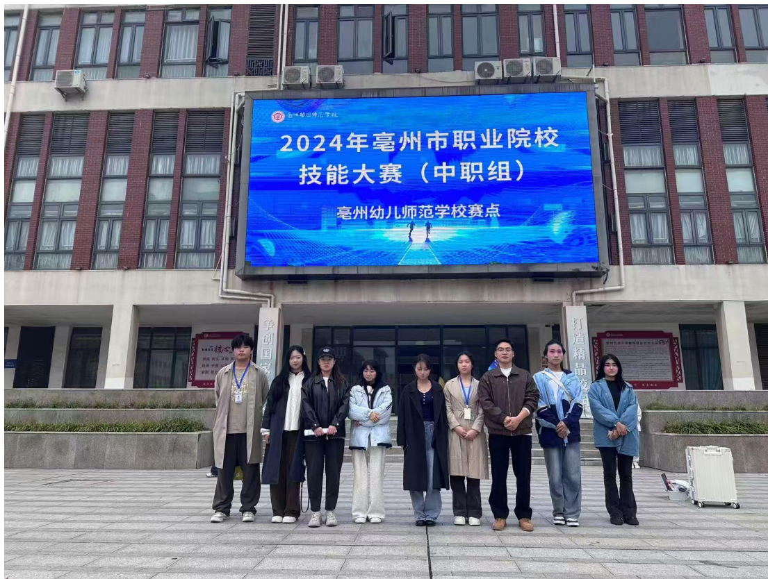
图 7 市技能大赛

2.2 技能成才。 学校高度重视学生技能发展，在不断改善实训条件，增加实践教学课时的基础上，通过校外实习实训，工学结合，强化学生技能培养。坚持以赛促学、以赛促教、以赛促改，积极组织学生参加各级各类技能大赛，切实提高学生技能培养水平。