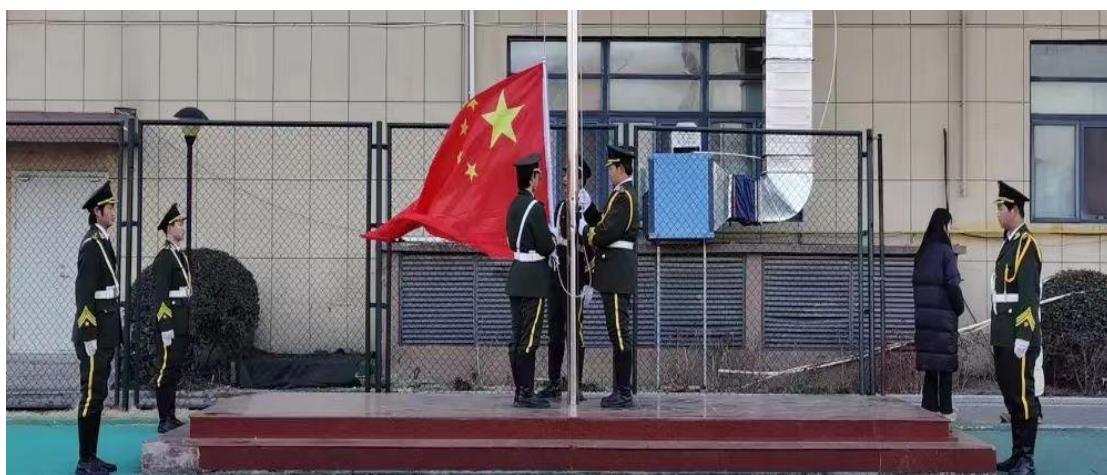
图 28 仪仗队进行升旗仪式

升旗仪式是我校对学生进行爱国主义教育和集体主义教育的重要手段。我校通过每周星期一早上的升国旗活动，营造良好的校园文化氛围，增强凝聚力、向心力和感召力，提高师生的民族自豪感和使命感。学校将升旗仪式作为一项常规的德育活动内容，对全校师生进行爱国主义、集体主义教育，弘扬主旋律，取得了很好的教育效果。在升旗仪式上，我校每次还进行不同主题的讲话发言，如“讲文明懂礼貌”、“做品学兼优学生”、“如何保持健康的心理状态”等，每个主题都有学生代表发言，教师代表发言，促进学生提高进步。