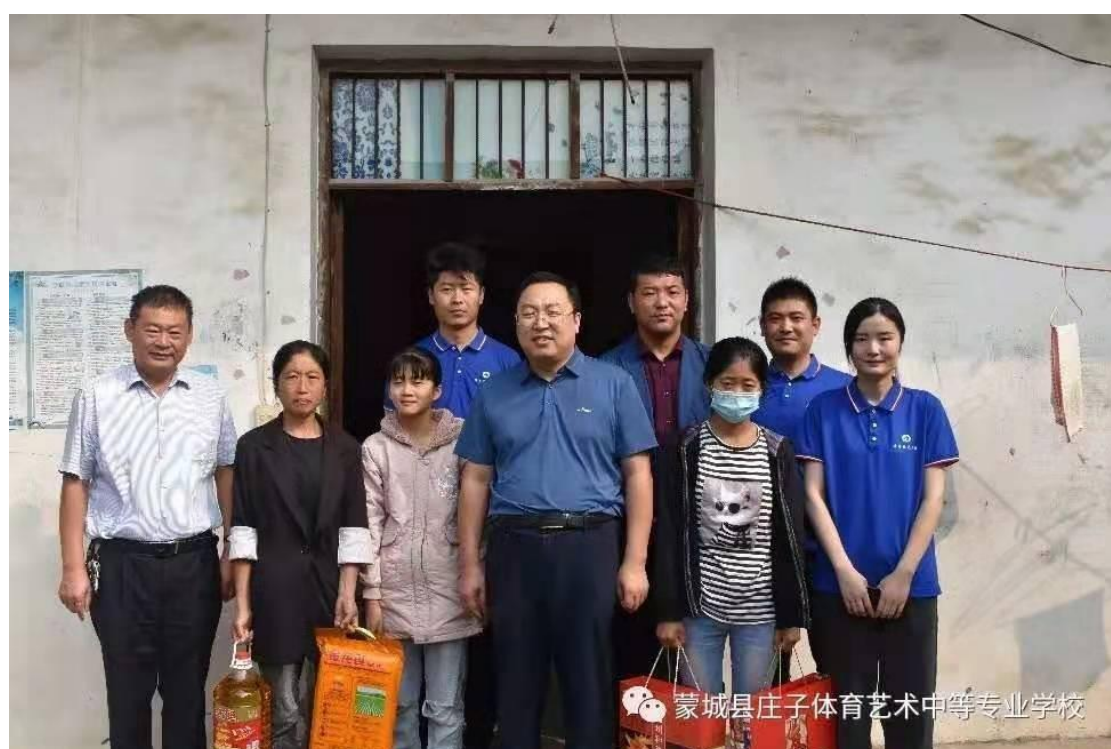
图 25 贫困生慰问帮扶

困生的帮扶工作，通过开展各种家访慰问活动，组织贫困生参与社会实践，鼓励贫困学生认真学习，从资金方面严格按扶贫政策减免，发放相关补助，稳定学生，减少辍学，同时发动学生参加职业技能培训考证，提高就业能力和就业质量，提资增收。学校还积极推荐就业、鼓励就业，发动毕业生参加对口升学考试，助力我县乡村振兴。