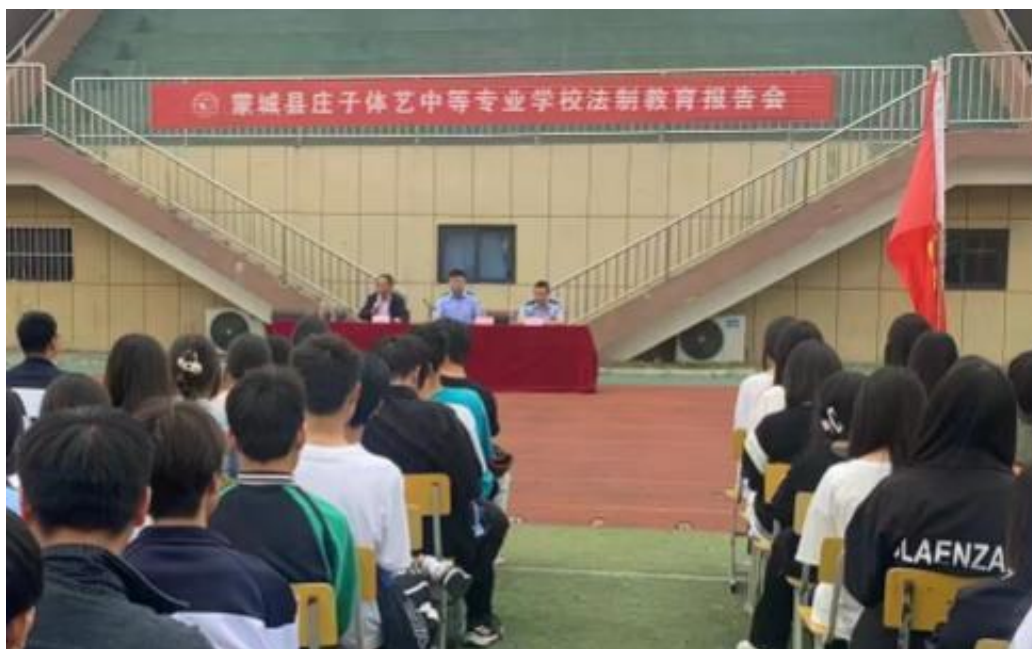
图 24 法治教育主题报告会