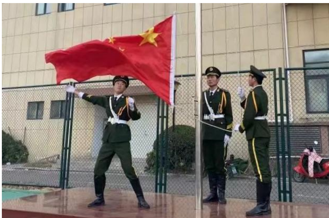
图 15 学校升旗仪式

4.1 中华优秀传统文化传承。 学校日常管理过程中，充分发挥“三风一训”的作用，贯彻“诚信 务实 创新 坚持”的校风，“立德树人 敬业爱生”的教风，“勤学善思 励志感恩”的学风，“德技并修 知行合一”的校训。通过开展经典诵读比赛、书画展、运动会等多种形式的活动，宣传中国传统文化、社会主义核心价值观、劳模精神、工匠精神。让学生了解中华优秀传统文化的灿烂与辉煌，增强文化认同与自信，形成学习和弘扬中华优秀传统文化的良好氛围。