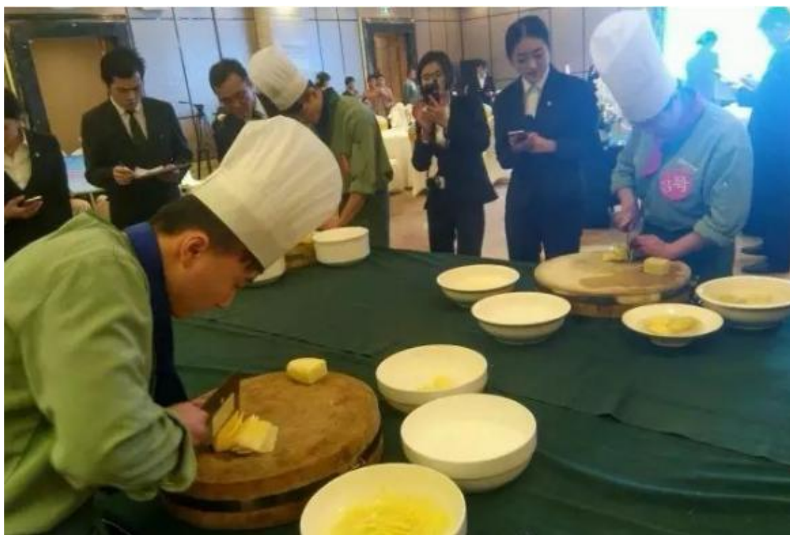
图 20 实习生岗前技能展示（烹饪）